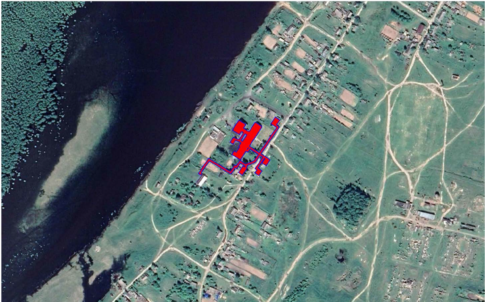
Рисунок 1.1 – Существующие и перспективные зоны действия источников теплоснабжения на территории села Лукашкин Яр